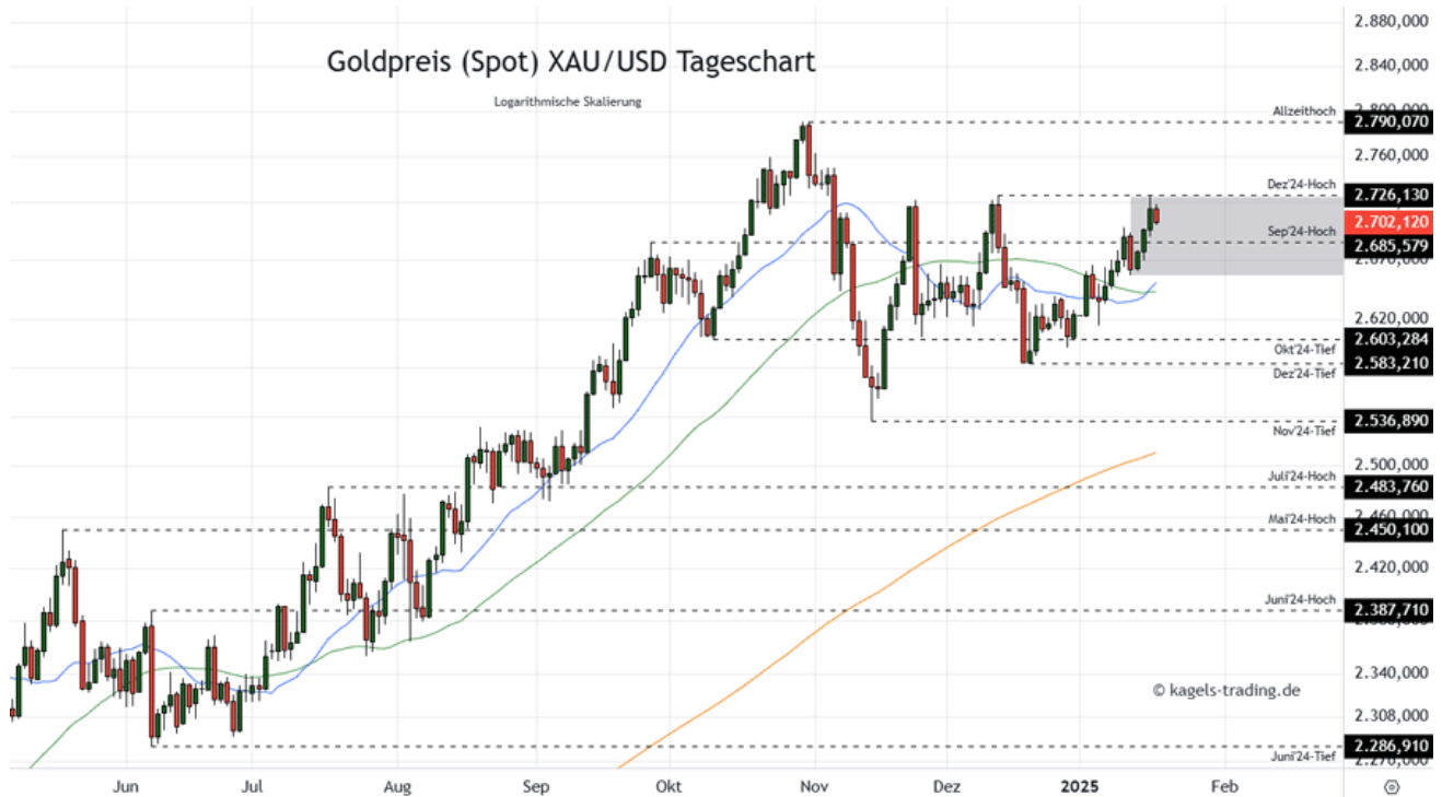
Goldpreis Prognose Tageschart - diese & nächste Woche (Chart: TradingView )

⌘; Mögliche Wochenspanne: 2740 $ bis 2.830 $