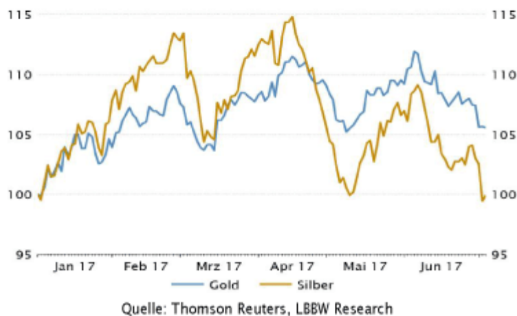
Chart der Woche: Gold und Silber in USD (indexiert ; 1.1.2017 = 100)

Zudem bleiben Edelmetalle weiterhin unter dem Aspekt interessant, dass sie eine wirksame Form der Diversifikation zum Schutz vor politischen Risiken darstellen. Ein zusätzlicher Pluspunkt bei Silber stellen die aktuell sehr positiven Indikatoren für die weltweite Konjunktorentwicklung dar. Die industrielle Nachfrage nach Silber dürfte damit noch etwas stärker ausfallen als bislang erwartet.