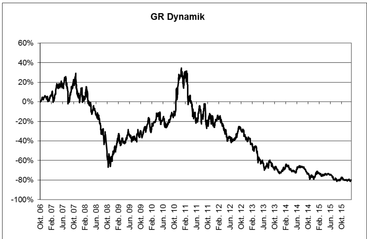
Abb. 2: Quelle: vwd group. Die Datenreihe zeigt die Wertentwicklung des GR Dynamik vom 16.10.2006 bis zum 31.01.2016. Die Wertentwicklung in der Vergangenheit ist kein Indikator für die zukünftige Wertentwicklung und keine Garantie für einen Erfolg in der Zukunft.